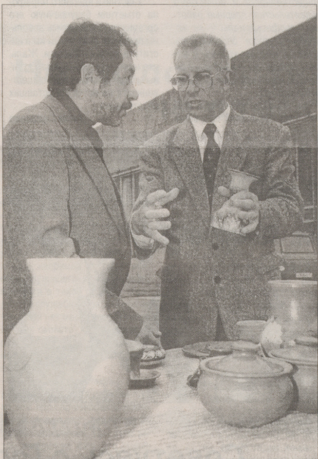
На прошлогодней выставке-ярмарке: - Скажи-ка, дядя, ведь не даром?

Сегодня, 14 октября, начинает свою работу 5-я региональная промышленно-торговая выставка-ярмарка "Гатчина-99". В ней традиционно примут участие около 100 предприятий Ленинградской области и Северо-Запада, в том числе и ПКФ "Ореол".